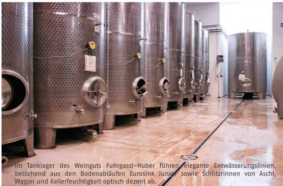
Im Tanklager des Weinguts Fuhrgassl-Huber führen elegante Entwässerungslinien, bestehend aus den Bodenabläufen Eurosink Junior sowie Schlitzrinnen von Aschl, Wasser und Kellerfeuchtigkeit optisch dezent ab.