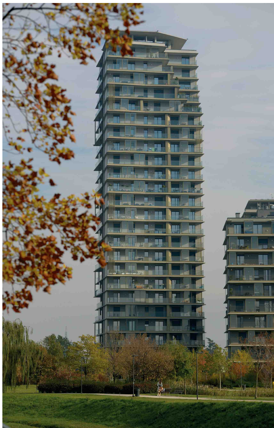
In diesem Gebäude liegt das Penthouse von Matteo Viviani.

Mit kostbaren Badlösungen aus Kaldewei Stahl-Emaille haben der italienische TV-Star Matteo Viviani und seine vierköpfige Familie in ihrem Mailänder Penthouse eine Spa-Oase geschaffen, die Design, Nachhaltigkeit und moderne Funktionalität gekonnt miteinander verbindet.